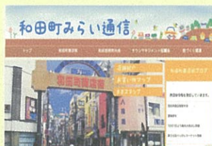
和田町みらい通信へアクセスください！