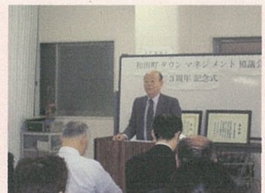
三周年記念式典の様子です

3月21(土)13:30～和田町西部町内会館で行われる予定です。3月28日(土)にはべっぴんマーケットも開催されます。楽しみにお待ちしております！