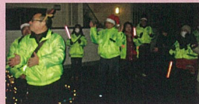
上) 役員による特製リアカー 下) 一本締めをする参加者