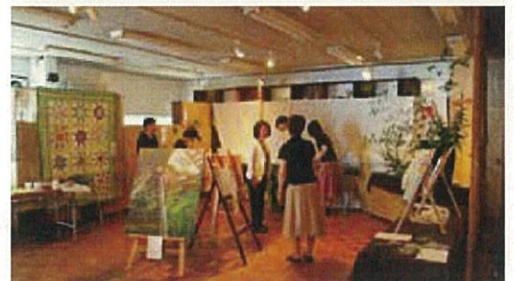
写真上: 普段の寺子屋の様子