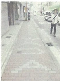
↑和田橋から国道16号まで続くすずかぜ舗装

毎年恒例になった打ち水大作戦は、今年も地蔵まつり24日の16時頃から予定されています。和田町商店街では、「ヒートアイランド対策モデル実験事業」として、横浜国立大学・和田町商店街・和田町西部町内会が協働で、打ち水や緑化推進などのヒートアイランド対策事業を進めてきました。その事業の1つである「すずかぜ舗装」が商店街に整備されて、約3年経ちます。