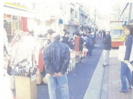
前回のべっぴんマーケットの様子。 歩行者天国に人と物が飛び出します！