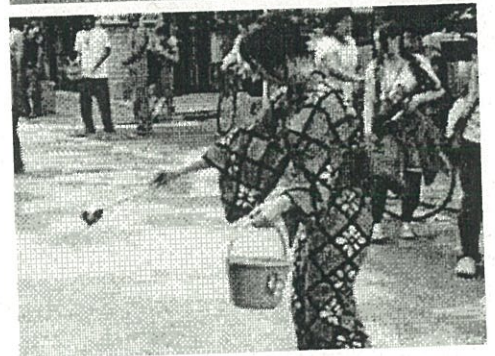
たくさんの方に参加していただきました。どうもありがとうございました。