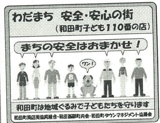
和田町子ども110番の店として商店街の30店舗が登録しており店頭はこのステッカーを掲示しています。