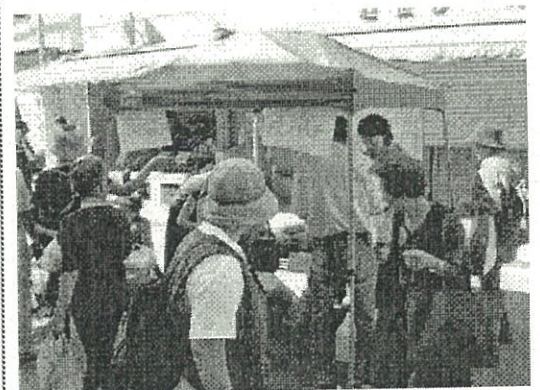
お弁当先行販売の様子