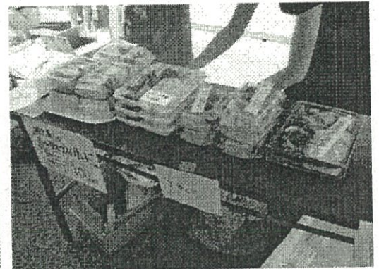
販売された「和田町商店街発 横浜国大行き特製弁当」（4種類）