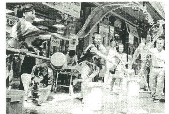
打ち水大作戦の様子(イメージ)