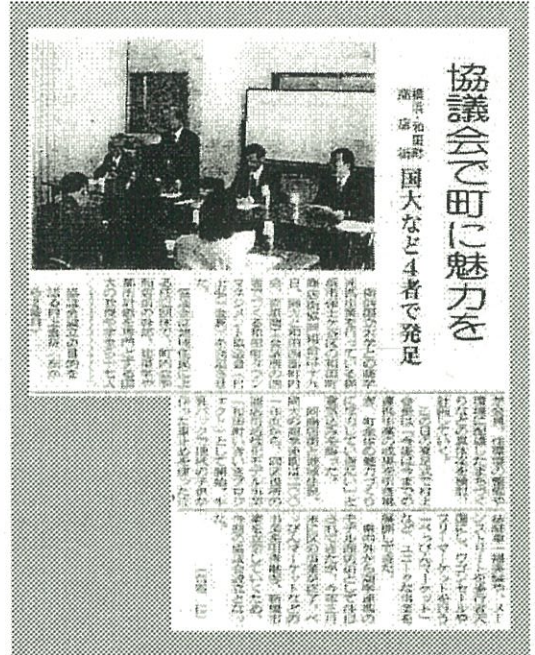
2005年4月20日神奈川新聞